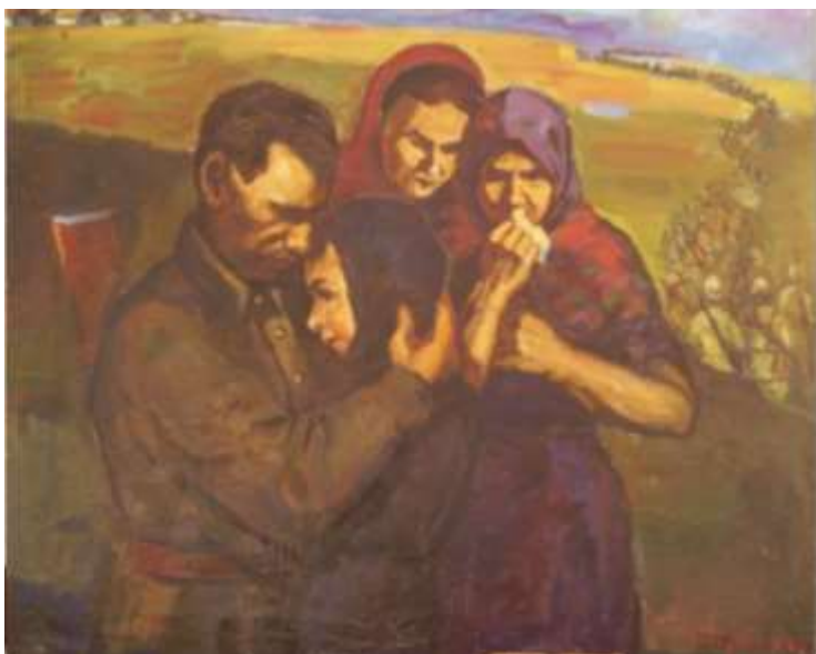
В. Шульга. «Проводы на войну».

Медаль I степени изготавливалась из серебра 925 пробы, медаль II степени – из бронзы.