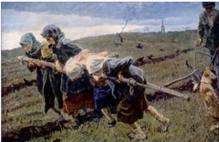
Авторы: Ткачевы А. и С. «В трудные годы»

Автор проекта медали – художник И.И. Дубасов.