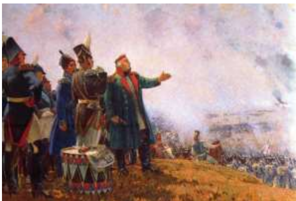
С.В. Герасимов. «М. И. Кутузов на Бородинском поле»

Орден Кутузова II ст. вручался 335 раз. Обладателем ордена №1 был командир 13-й гвардейской стрелковой дивизии, защищавший Сталинград, А.И. Родимцев.