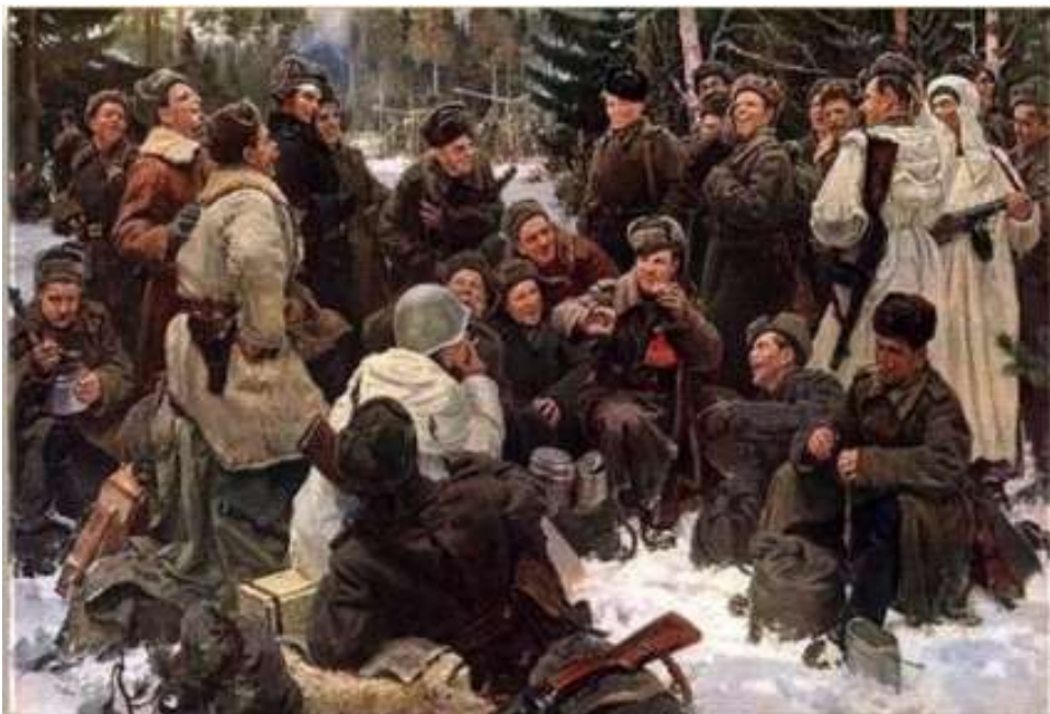
Ю.М. Непринцев. Картина «Отдых после боя».