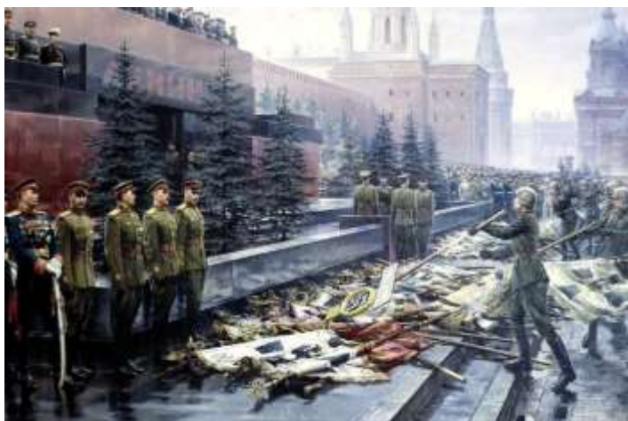
Михаил Хмелько. «Триумф победившей Родины», 1949 г.

Полными кавалерами ордена Славы стали 27 воинов Уральского добровольческого танкового корпуса.