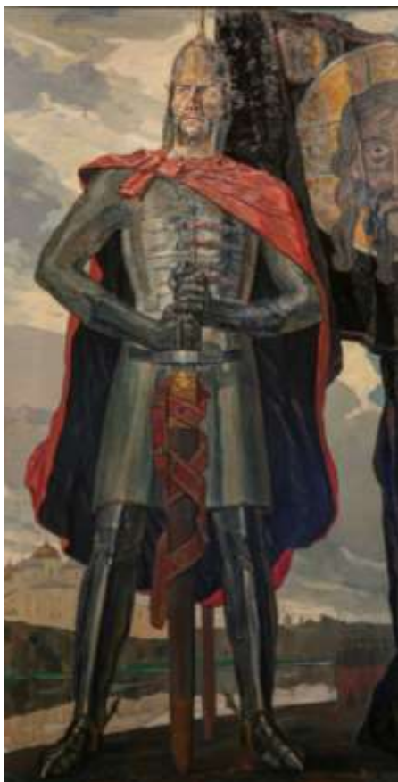
Павел Корин. «Александр Невский».