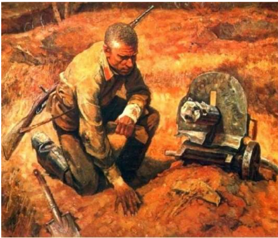
Б.И. Тарелкин. «Товарищи».

Автор рисунка медали – художник Н.И. Москалев.